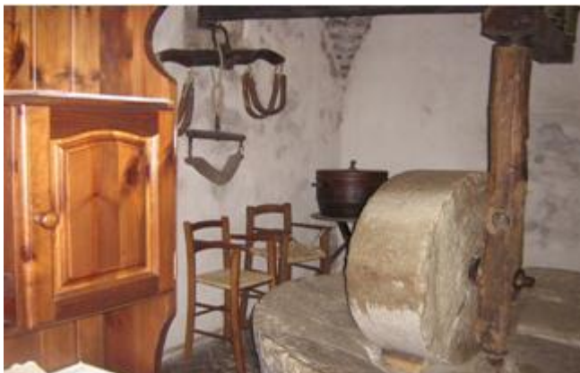
„Małe muzeum” - tłocznia oleju

spuścizny kulturowej wsi. Pełne wykorzystanie tych budynków pozwala na możliwość ożywienia wiejskich tradycji, nabieranie szacunku oraz powracanie do tradycji i kultury ludowej. Często w gospodarstwach obserwuje się tworzenie „małych muzeów”, gdzie można poznać tajniki wyrobu oliwy, wina lub tradycyjnych wędlin.