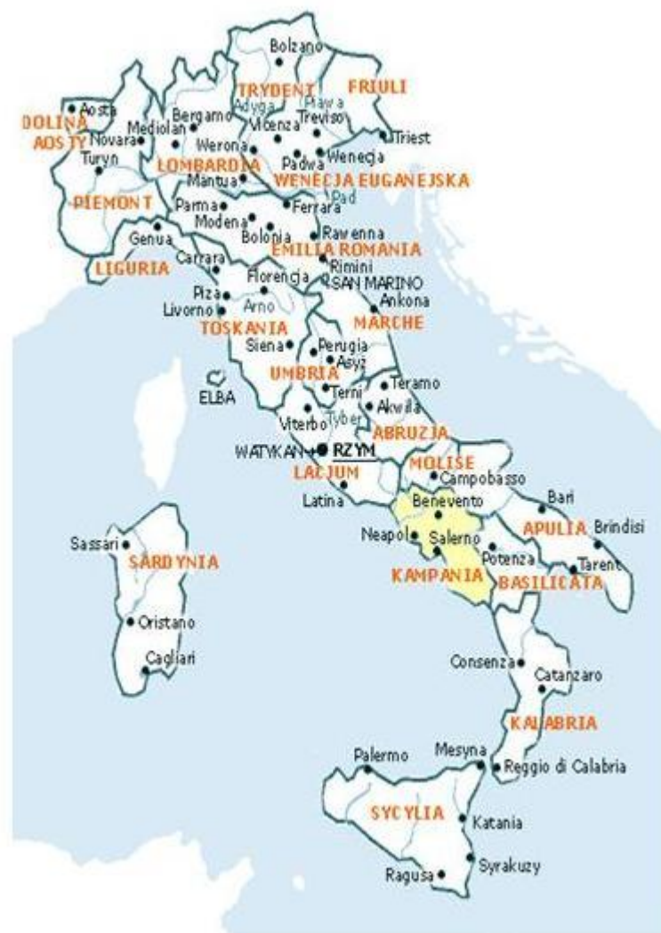
Mapa przedstawiająca regiony Włoch

Agroturystyka daje możliwość na pozyskiwanie dodatkowych źródeł dochodów, które przeznaczone są na rozbudowę i modernizację gospodarstw, stworzenie nowoczesnej i komfortowej bazy noclegowej.